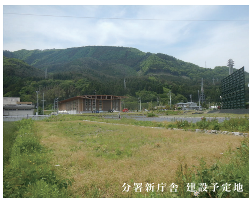
分署新庁舎 建設予定地