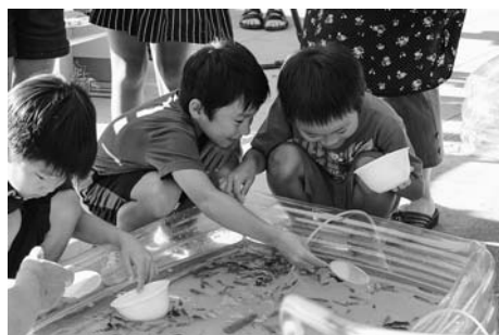
▲金魚すくいに子どもたちも夢中