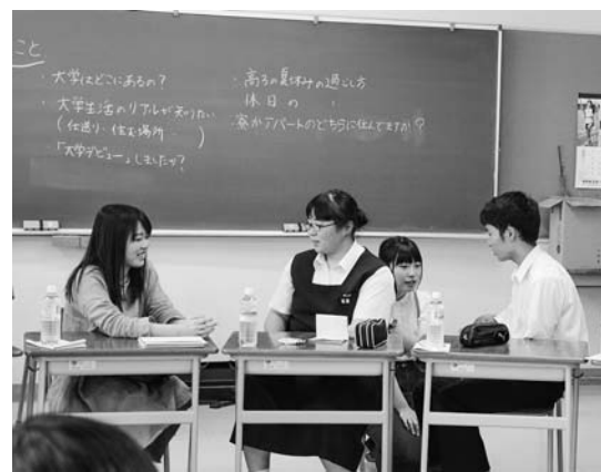
▲高校生と交流する学生たち