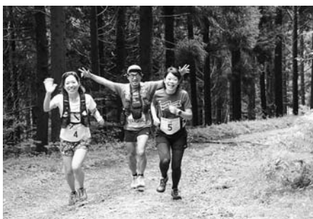
▲自然を楽しみながら走ります

あり、手を挙げるなど声援に励んでいました。 無事に全ランナーが完走し、表彰式ではランナーから「いいコースだった。ぜひ来年以降も開催してほしい」との話がありました。 実行委員会では今回の結果を踏まえ来年以降について検討することになっています。