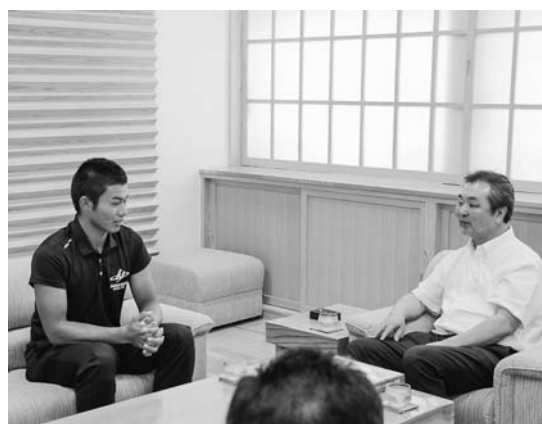
▲神田町長へ報告する紺野選手