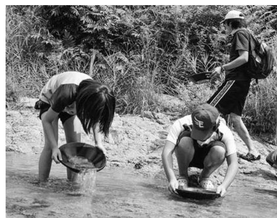
▲夢中になって砂金を探す参加者

8月4日、上有住八日町地内の気仙川河川敷で砂金採り体験が行われました。 同体験は、本町で展開している森林環境学習の一環として開催。当日は子どもから大人まで約20人が町内外から参加しました。 まず、参加者たちは気仙川の歴史について説明を受け、名字や町内の地名から住田と金のつながりや平泉、世界との繋がりなどを学びました。 座学が終わると、気仙川へ移動し早速砂金採りへ。参加者は、それぞれポイントを変えながら夢中になって砂金を探し求めていました。