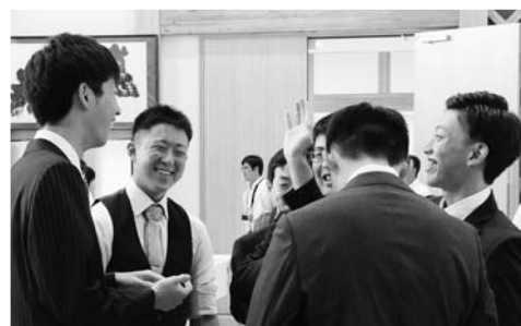
▲友人との再会に笑顔

た料理が並びました。また、小中学校時代の恩師によるスピーチやそれぞれの近況報告が行われ、参加者たちは、久しぶりの友人や恩師との再会に笑顔を見せていました。