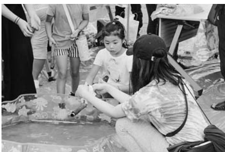
▲学生による染物体験

この日は、町内の児童や愛知学院大学、東京理科大学の学生など約200人が参加。射的やお菓子釣りのコーナーが人気を集めたほか、東京理科大学の学生により作成された竹のモニュメントが設置され、世田米学童クラブに参加している児童により染められた藍染めが飾られました。