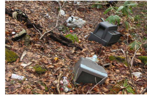
▲不法投棄され散乱しているゴミ

■不法投棄とは 廃棄物処理法で禁止されている「廃棄物をみだりに捨てる行為」を不法投棄といいますが、不法投棄は一人一人の意識の問題から発生するものであり、その防止のためには意識の啓発が重要です。町内の現状は、国・県・町道などへの空き缶やレジ袋などの投棄をはじめ、不法投棄は後を絶たない状況にあります。また、皆さんのご協力のもと実施している河川清掃の際には、テレビなどの家電製品の回収もありました。軽い気持ちで行ったポイ捨てが他人に迷惑をかけることになり、投棄されたもの